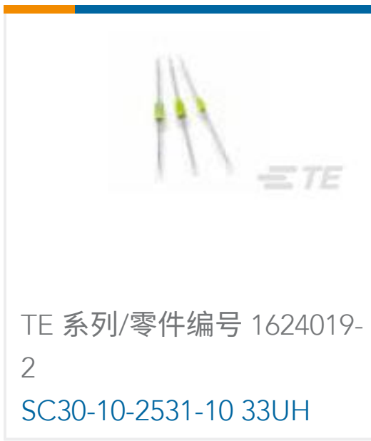
TE 系列/零件编号 1624019-2 SC30-10-2531-10 33UH AMMO 1000