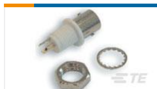
TE 系列/零件编号1-1337451-0 BNC BHSkt 50Ohm Silver Pltd