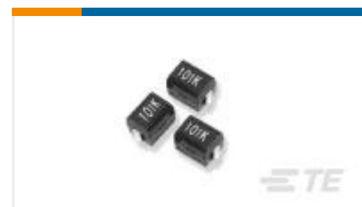
TE 系列/零件编号1624094-1 3613C 10UH 10%