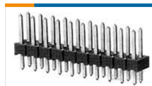
TE 系列/零件编号3-826656-2 AMPMODU II PIN HDR. 2X32P