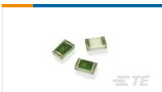
TE 系列/零件编号1676193-2 RN 0805 150K 0.1% 10PPM 1KRL