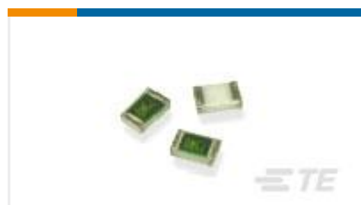
TE 系列/零件编号1676703-1 RN 0805 49R9 0.1% 10PPM CUT LENGTH