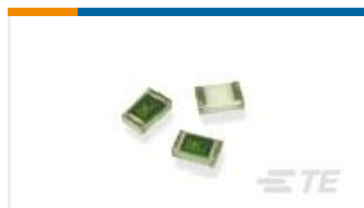
TE 系列/零件编号1676282-1 RN 0805 2K0 0.1% 10PPM CUT LENGTH