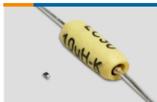
高频和射频电感器(69)